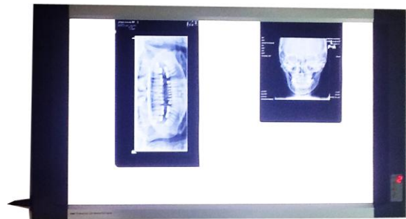
รูป 1.1 : ภาพแสดงการทำงานแบบ 2 view

หมายเหตุ : ขนาดดังกล่าวเป็นค่าประมาณ ซึ่งอาจคลาดเคลื่อนได้